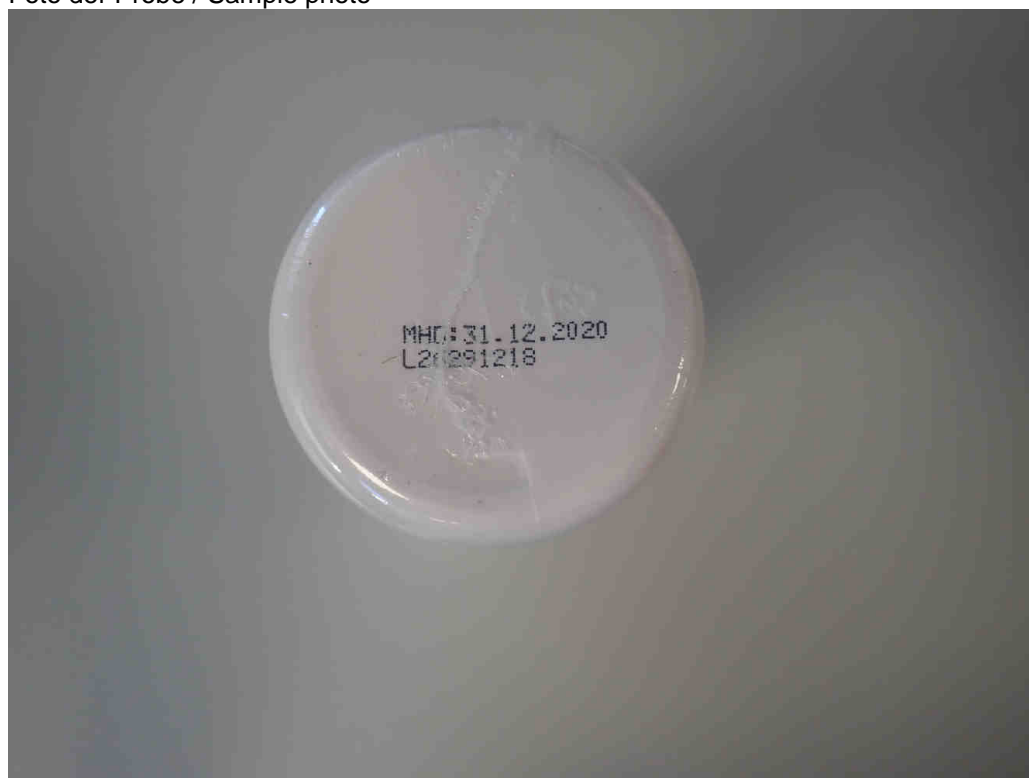
Foto der Probe / Sample photo