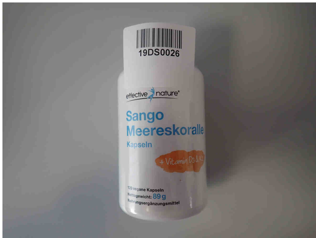
Foto der Probe / Sample photo